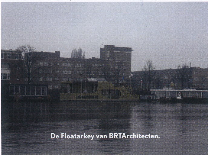
De Floatarkey van BRTArchitecten.

gende constructie is uitgevoerd in geschild rondhout, al kun je nog twisten over de specifieke soort. Ook het dak en de vloeren zijn van een nader te bepalen houtsoort." 'Floatarkey': dat is de naam van het ontwerp van een drijvende, autarische woning van BRTArchitecten, ECN en vier studenten, waarmee in het kader van de wedstrijd Duurzaam Drijvend Wonen een eervolle vermelding werd verdiend. "De lucht is kostbaar, want alles deelt dezelfde lucht. De bomen, de mensen, de dieren, alles heeft deel aan dezelfde lucht." Deze woorden van indianen-opperhoofd Seattle vormden de inspiratie voor het ontwerp van Erik van Wel. De glooiende vorm verwijst naar de beweging van het water. Het dakterras geeft het gevoel aan het roer van een schip te staan en de zichtbare installaties, zoals zonnecollectoren en een windmolen, zorgen voor een be-